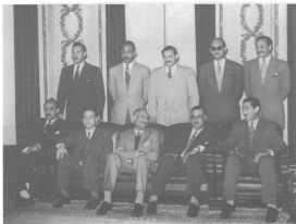
قيادة الثورة بالملابس المدنية